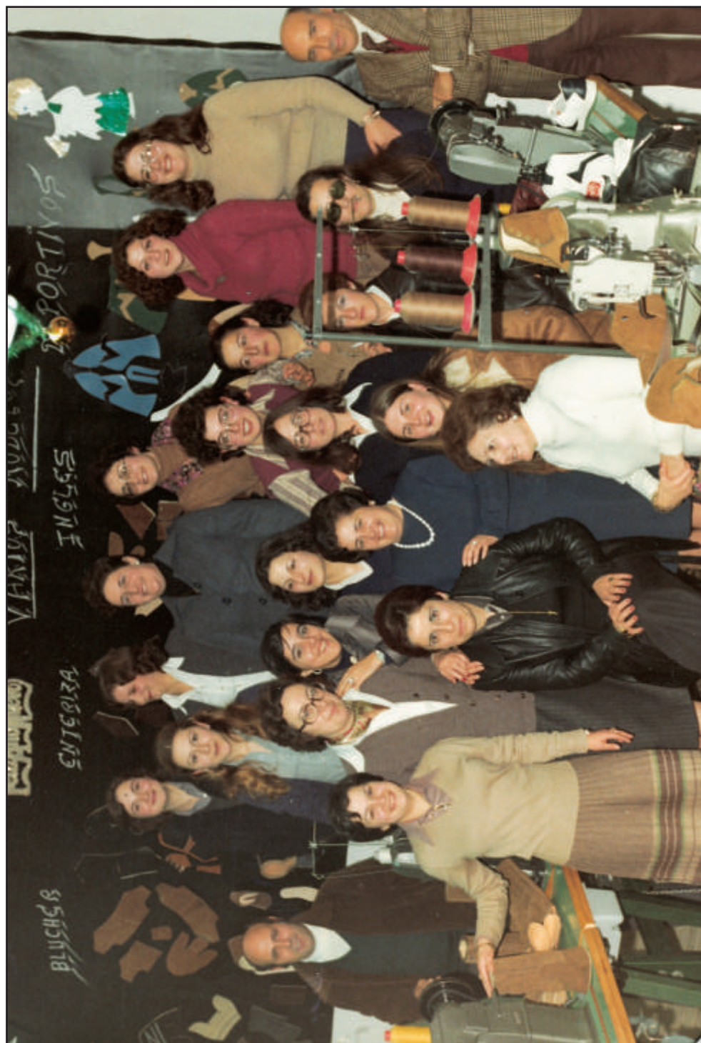
Cooperativa de Calzado en Alba de Tormes.