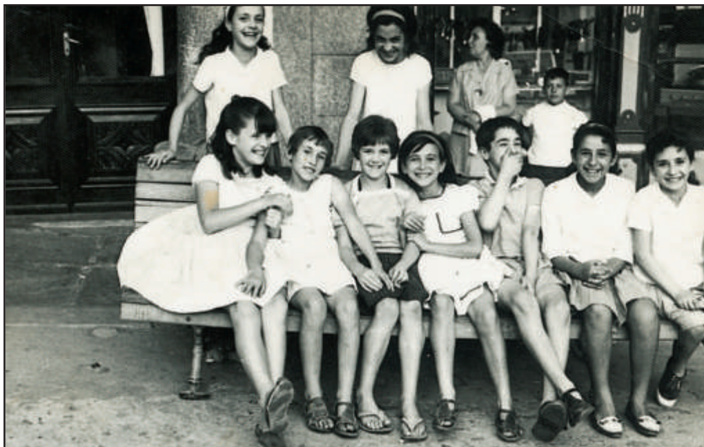
1960. Plaza Mayor de Alba. El presente de un pasado.