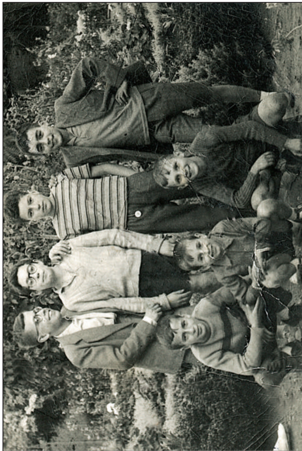
1961. En el espolón. Qué foto más entrañable.