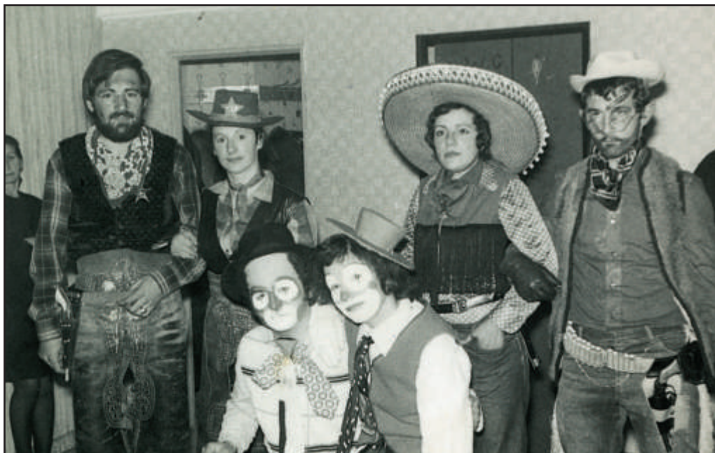
Carnaval de 1973. Alba de Tormes.