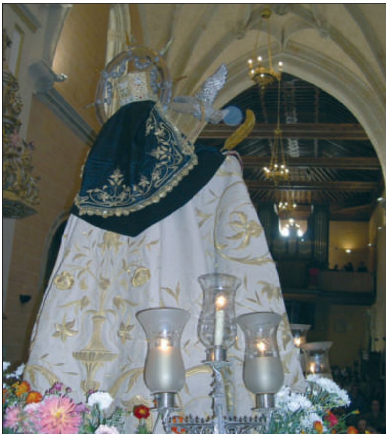
La imagen de Sta. Teresa con el manto de 1916 en la Procesión de las Fiestas de Octubre.

Pero cuando se estrenará todo el conjunto en las fiestas de octubre 1916, la revista "La Semana Católica", 1916, nº 17, hace esta descripción que merece la pena reproducir: