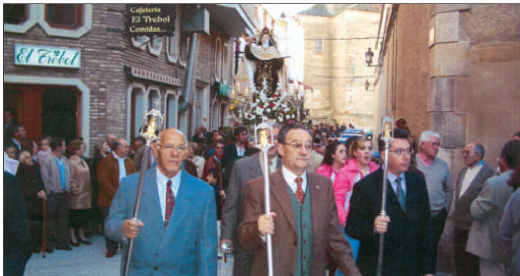
Procesión de S. Teresa, octubre 2004 (Foto Manuel Cruz).

Únicamente hemos hallado un testimonio que parece indicar que sí, que había algo, pero no hemos podido constatar directamente la referencia por lo que mantene-mos nuestras serias dudas. Pero ofrecemos la noticia. Se trata del siguiente documen-to conservado en el Archivo Histórico Nacional de Madrid (AHN, Consejo de Castilla, gobierno, legajo 2209, n° 24):