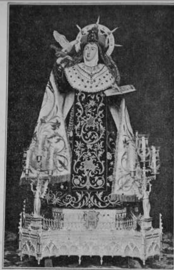
LA HERMOSÍSIMA IMAGEN DE SANTA TERESA DE JESÚS SEGÚN SE VENERA EN ALBA DE TORMES, CON EL NUEVO HÁBITO, CAPA Y ANDAS ESTRENADAS EN LAS FIESTAS DE OCTUBRE DEL PRESENTE AÑO EN LA VILLA DUCAL

Fotografía de tal y como apareció la imagen de Sta. Teresa en octubre de 1916.