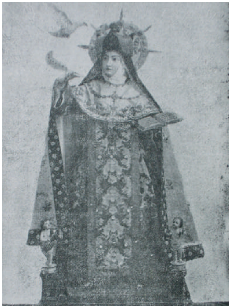
Imagen de S. Teresa con el hábito antiguo y las andas procesionales anteriores a 1914.