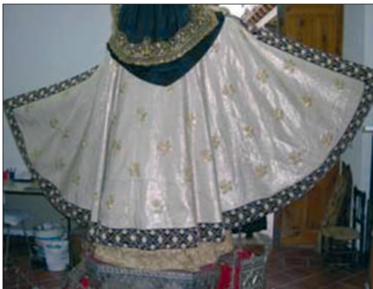
La capa más antigua de Sta. Teresa usada en las fiestas de Agosto (ver pp. 143-155).

Muchos años hace y que no dudamos remontar hasta la beatificación de la Mística Doctora y fundadora Teresa de Jesús, nuestra digna Patrona, cuyas insignes reliquias se veneran en esta Villa, se le vienen dando solemnes cultos y celebrándose sus octavas con tanto esplendor que, a pesar de las turbulencias que afectaron a nuestra