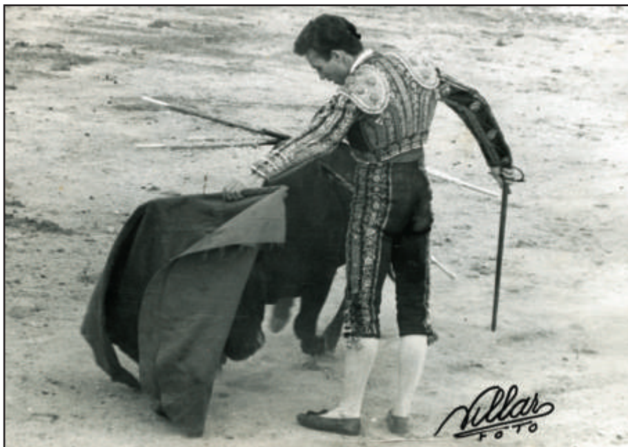
Las Rozas (Madrid). Siguiendo los triunfos. Sale a hombros con tres orejas y un rabo.