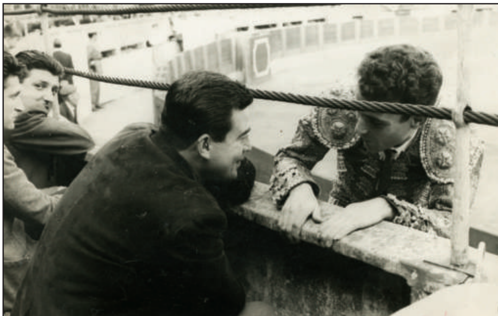
Brindando a su apoderado en la segunda tarde del NORTE.