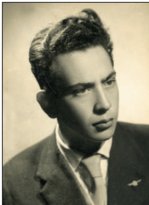
El autor del reportaje en el año 1960, 5 de mayo.