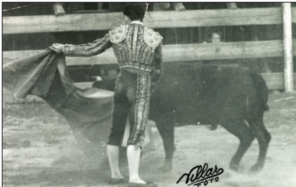
La misma novillada en Las Rozas.