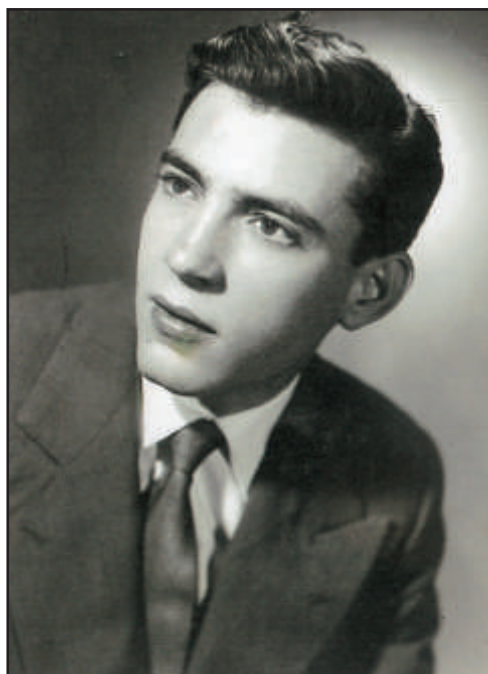
La figura del toreo que no pudo ser, amigo íntimo del autor en el año 1960.