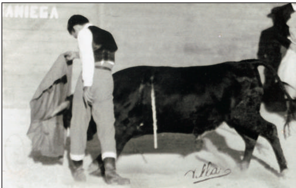
Festival Benéfico en Torrejón de Ardoz (Madrid).