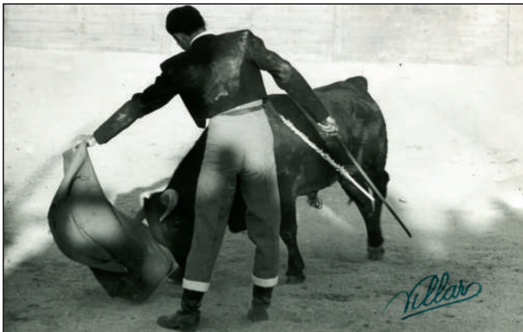
Torrejón de Ardoz. Iniciando un majestuoso natural.