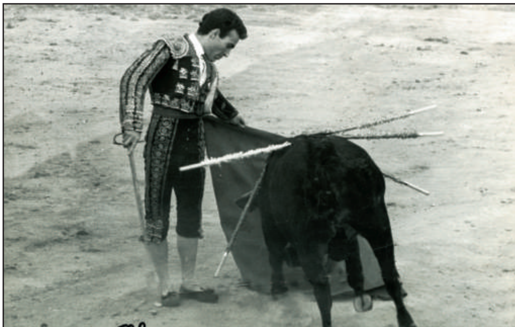
En las puertas de Madrid. Novillada sin picar en Las Rozas.