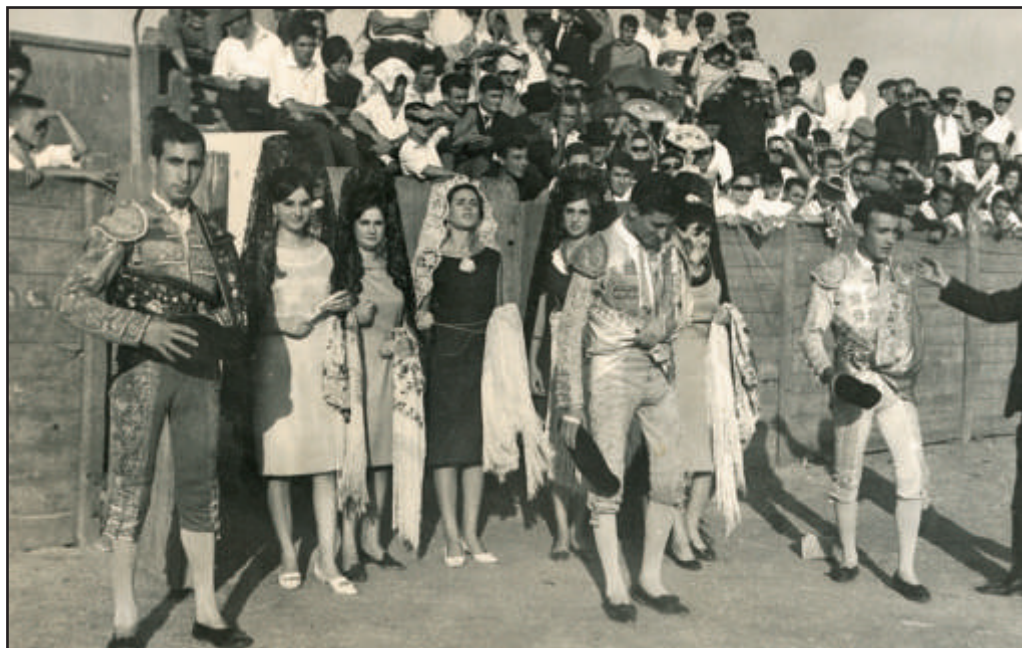
Continuando su duro aprendizaje, en un pueblo de Madrid. Año 1960.