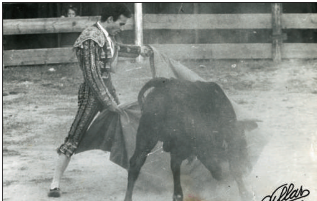
Fue un gran maestro con el capote. Las Rozas.