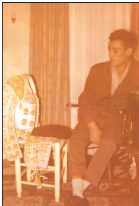
Joselito de Alba, meditando su retirada.