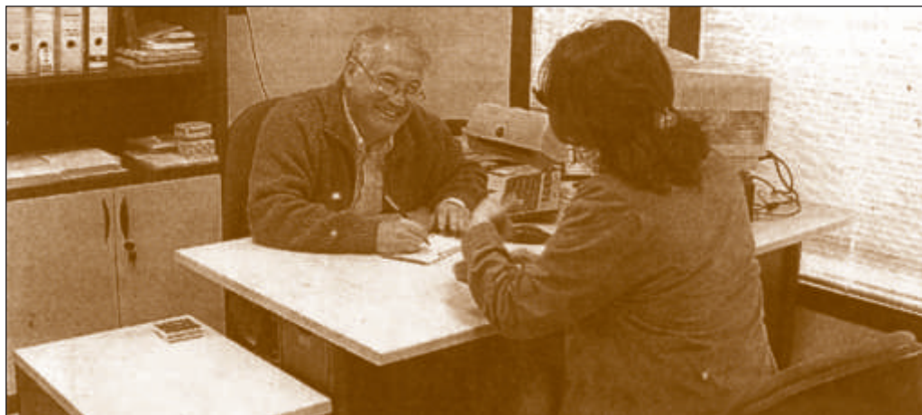
Durante la jornada de apertura de puertas, el nuevo centro funcionó con normalidad y atendió a casi 200 personas. Un médico del centro, en una de las nuevas consultas.