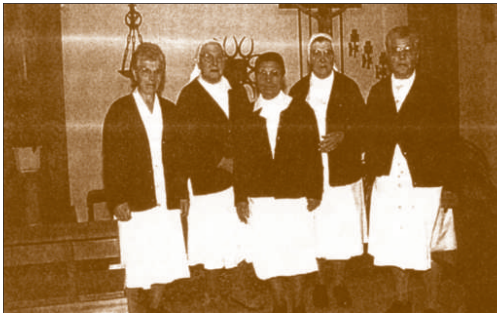
Últimas Hijas de la Caridad que ejercieron su Santa Misión en Alba de Tormes a las que ASCUA rindió homenaje el 10 de julio de 2004.